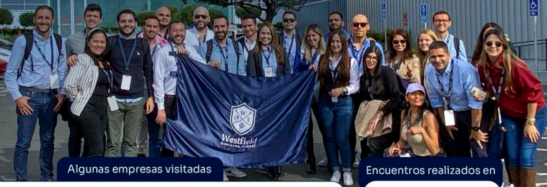
Algunas empresas visitadas

A lo largo de esta semana, los asistentes conocerán las herramientas necesarias para adaptarse a las nuevas realidades del mercado y aprenderán cómo aumentar la probabilidad de que un negocio funcione.