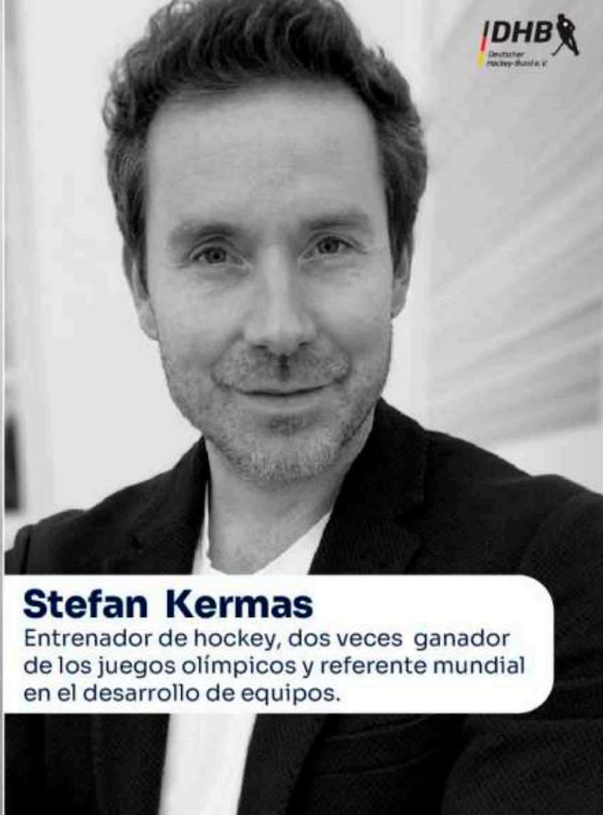
Stefan Kermas Entrenador de hockey, dos veces ganador de los juegos olímpicos y referente mundial en el desarrollo de equipos.