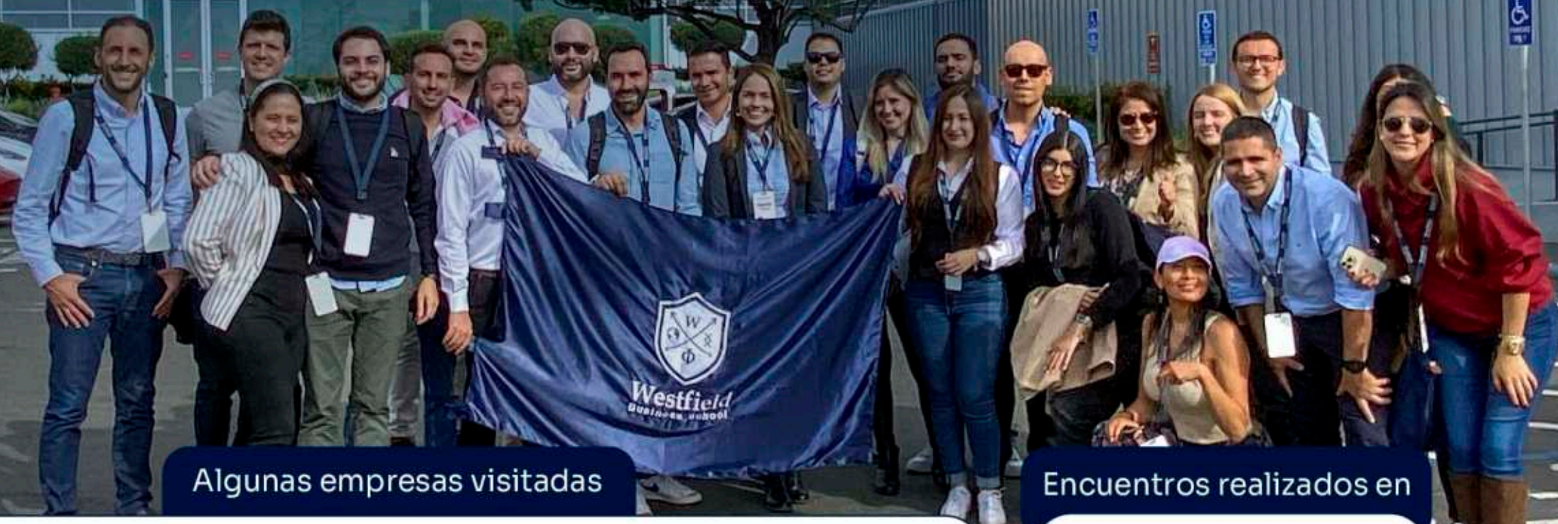
Algunas empresas visitadas

A lo largo de esta semana, los asistentes conocerán las herramientas necesarias para adaptarse a las nuevas realidades del mercado y aprenderán cómo aumentar la probabilidad de que un negocio funcione.