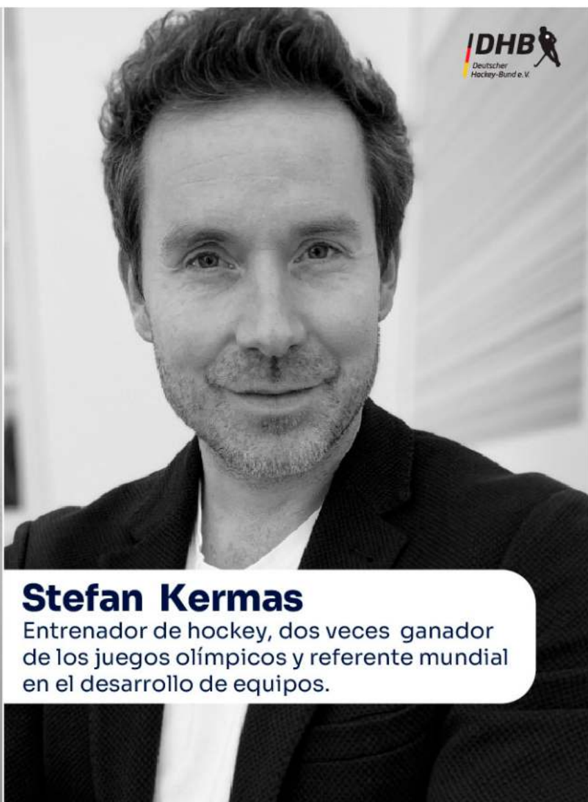
Stefan Kermas Entrenador de hockey, dos veces ganador de los juegos olímpicos y referente mundial en el desarrollo de equipos.