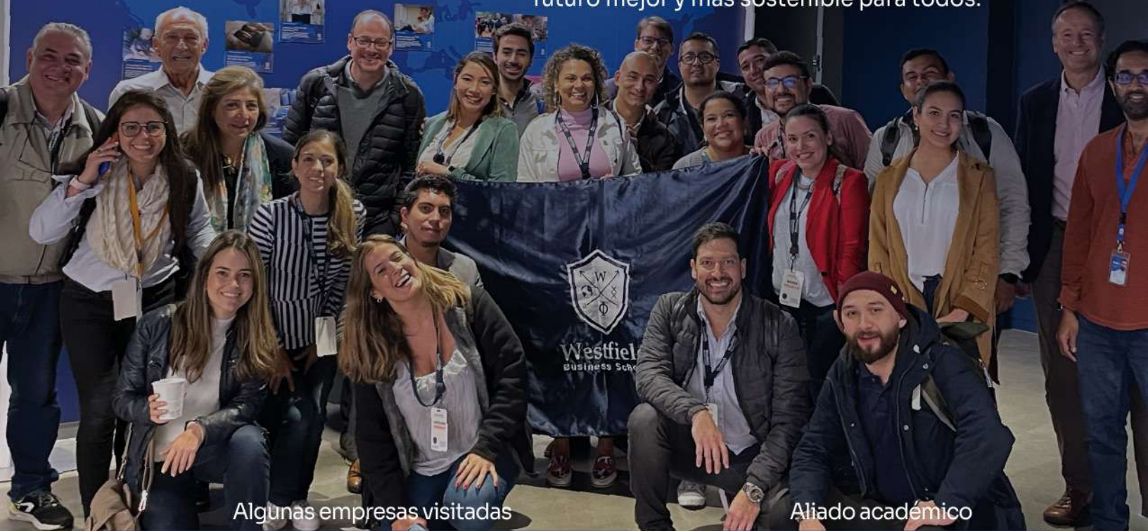
Algunas empresas visitadas

Improving lives through meaningful innovation all around the world