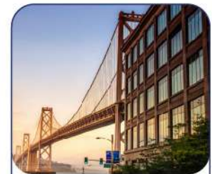
San Francisco Silicon Valley

Los retos actuales de los negocios exigen conocer referentes mundiales y comprender cómo estos lideran sus industrias. En estas International Experiences presenciales tendrás la oportunidad de aprender de grandes compañías y hacer networking con ponentes y compañeros.