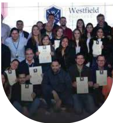
📍 The Valley: International Experience 2019