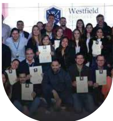
📍 The Valley: International Experience 2019