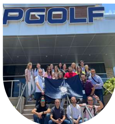
📍 TOP GOLF International Experience 2022